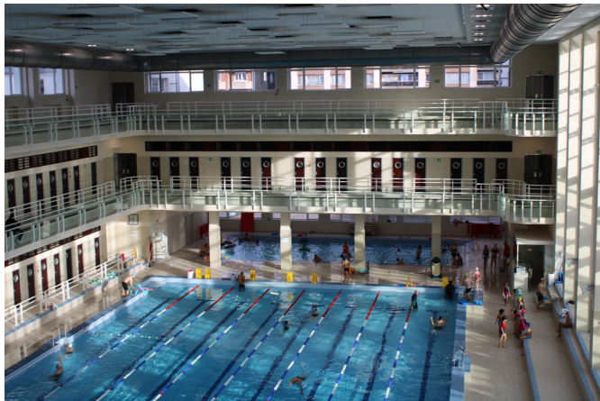
Grand bassin et bassin d'apprentissage du Neptunium

La piscine du Neptunium à Schaarbeek est un bel exemple de style Paquebot ou « Streamline ». Ce style architectural regorge de formes courbes, de hublots et de balustrades, autant d'éléments empruntés à l'univers nautique.