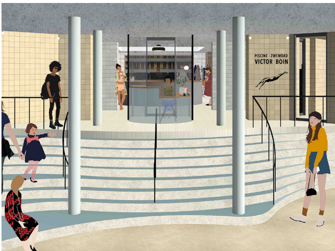
Dessin de conception de l'entrée de la piscine Victor Boin (Photo : AAC Architecture)