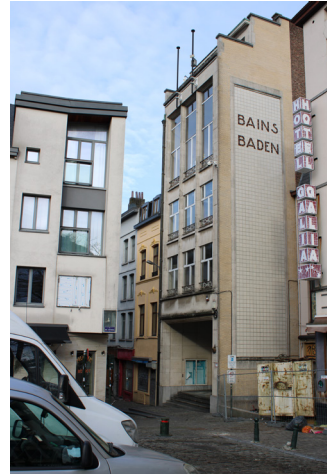
La façade orientée verticalement de la piscine du Centre, de style moderne

C'est l'une des trois piscines des Bains de Bruxelles (piscines de la Ville de Bruxelles). Avec son design épuré, ses gigantesques baies vitrées et ses deux piscines l'une au-dessus de l'autre, ce complexe sportif et de natation est connu depuis des décennies comme l'un des plus brillants exemples de l'architecture bruxelloise, à la croisée de l'Art déco et du modernisme.