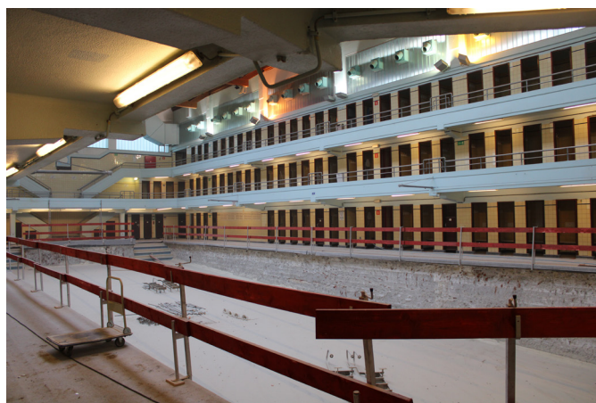
Piscine Victor Boin pendant les travaux

L'établissement est mis en conformité avec les normes et exigences actuelles, et l'organisation de son fonctionnement interne est revue. Son utilisation sera plus conviviale, notamment par l'aménagement d'un accès pour les personnes à mobilité réduite et par l'amélioration de la sécurité. La configuration est revue : au rez-de-chaussée vont venir de nouvelles cabines familiales, la cafétéria va être réaménagée et le personnel sera doté d'un nouvel espace bureau dans l'extension du 2 e étage.