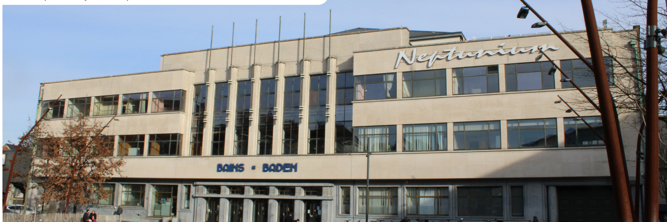
L'imposante façade du Neptunium

Le bâtiment a subi une importante rénovation : désamiantage, améliorations structurelles, restauration de l'étanchéité, travaux d'électricité, mesures d'économie d'énergie et modernisation des aménagements. Par exemple, les vestiaires ont été revus et de nouveaux vestiaires ont été ajoutés pour les familles et les moins-valides, et un système moderne de surveillance par caméras pour prévenir les noyades a été installé. Quant à l'intérieur, il a été rafraîchi tout en conservant le style moderniste des années 50.