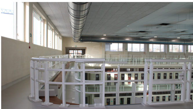
Balustrades, hublots et longues lignes droites donnent au Neptunium un air marin.

Le Neptunium a ouvert en 1953 et a été agrandi en 1957. À l'époque, son bassin de 33 mètres répondait aux normes olympiques. Rénovée de 2017 à 2023, cette piscine est à présent rouverte au public.