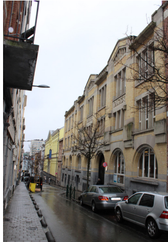
La façade monumentale de la piscine de Saint-Josse-ten-Noode

Ce magnifique établissement public Art déco a été minutieusement restauré de 2009 à 2019. Les travaux de rénovation ont inclus le bassin de natation, les vestiaires, l'installation d'un nouveau système de filtration de l'eau et de prévention des noyades, le placement d'un nouveau système de ventilation, de nouvelles douches et toilettes, un ascenseur et un dispositif mobile d'aide des personnes à mobilité réduite.