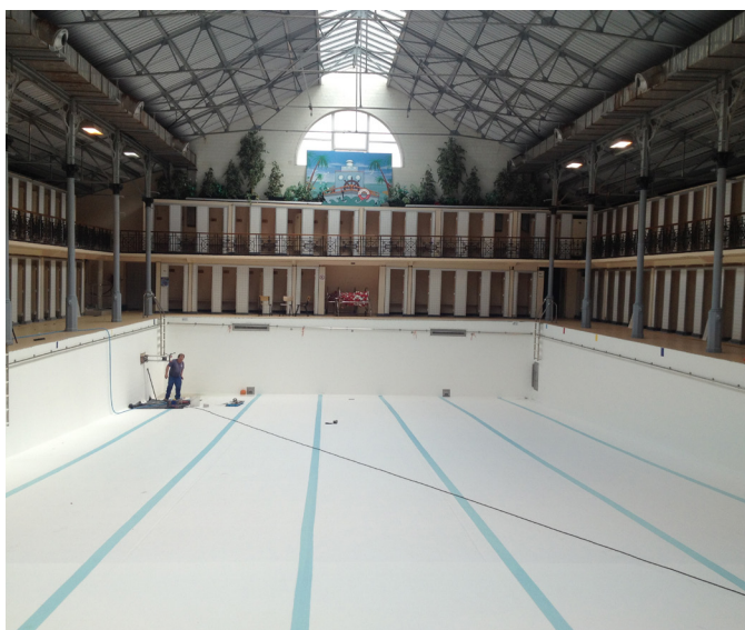
Piscine d'Ixelles en cours de rénovation

En rénovation depuis 2020, la piscine devrait rouvrir ses portes mi-2024. La façade et la halle centrale, y compris le bassin lui-même, sont des éléments de patrimoine protégés et seront restaurés à l'identique. De même, la disposition typique des cabines de vestiaires autour du bassin sera conservée.