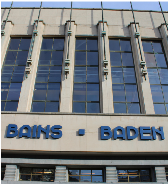
Façade avant du Neptuneium à Schaerbeek

Ce n'est un secret pour personne : Bruxelles regorge de trésors pour les amateurs d'Art nouveau, d'Art déco et de Modernisme. Nombreux sont les touristes qui viennent à Bruxelles pour admirer ses bâtiments datant du tournant des 19e/20e siècle et de l'entre-deux-guerres. Ce que l'on sait moins, c'est qu'une grande partie des piscines publiques bruxelloises datent du début du 20e siècle, et que certaines d'entre elles sont de petits bijoux sur le plan architectural. Quelques-uns de ces « bains » ont récemment été rénovés, tandis que d'autres rouvriront prochainement leurs portes. Ne manquez pas d'aller y jeter un coup d'œil après leur réouverture.