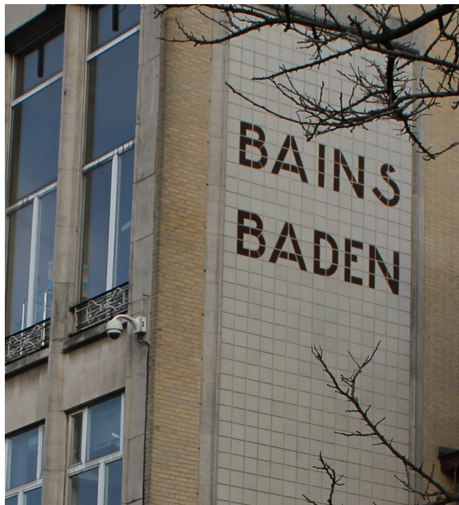
Les Bains de Bruxelles, dans les Marolles