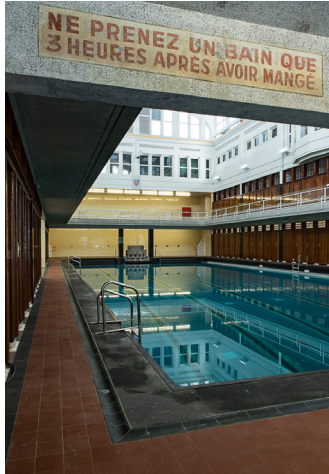
L'intérieur de la piscine de Saint-Josse-ten-Noode (Photo : AAC Architecture)

La piscine de Saint-Josse-ten-Noode est incontestablement l'une des plus belles de Bruxelles. Le marbre y est omniprésent dans son hall d'entrée et sa cage d'escalier, tant au sol que sur les murs.