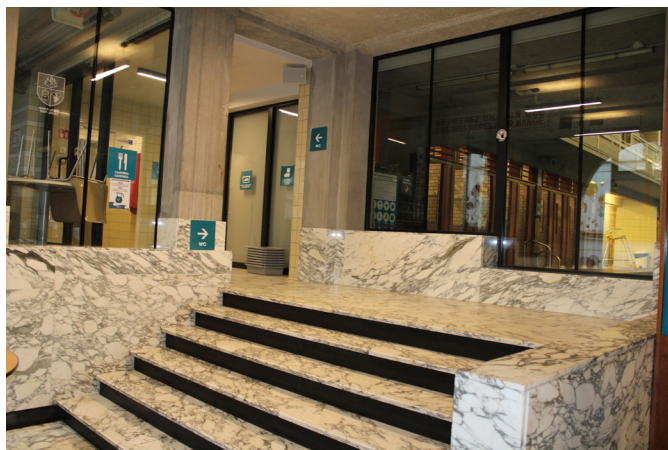
Profusion de marbre à Saint-Josse-ten-Noode

La façade, le hall d'entrée monumental aux grands pans de marbre et les rangées de cabines de vestiaires entourant la piscine au niveau du bassin et au 1er étage ont tous été conservés.