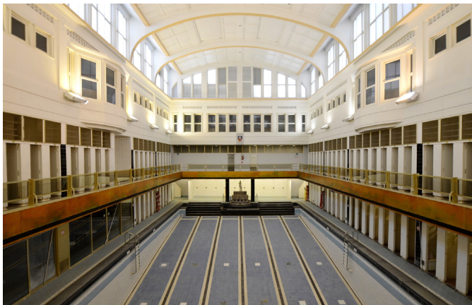
L'intérieur de la piscine de Saint-Josse-ten-Noode