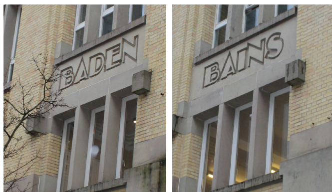
Les Bains de Saint-Josse-ten-Noode

Les emblématiques bains de la première moitié du siècle passé, de style Art déco ou Paquebot, avaient une fonction sociale en plus de leurs évidentes fonctions sportives et hygiéniques. Les salles de bains domestiques individuelles n'étant alors pas aussi répandues qu'aujourd'hui, la plupart des piscines servaient également de salle de bains et de lieu de rencontre pour les habitants du quartier de l'époque. On venait y prendre une douche et, dans certains établissements, les citoyens plus nantis pouvaient également s'offrir un bain turc. Les piscines étaient des oasis qui offraient aux Bruxellois une activité récréative plus sophistiquée.