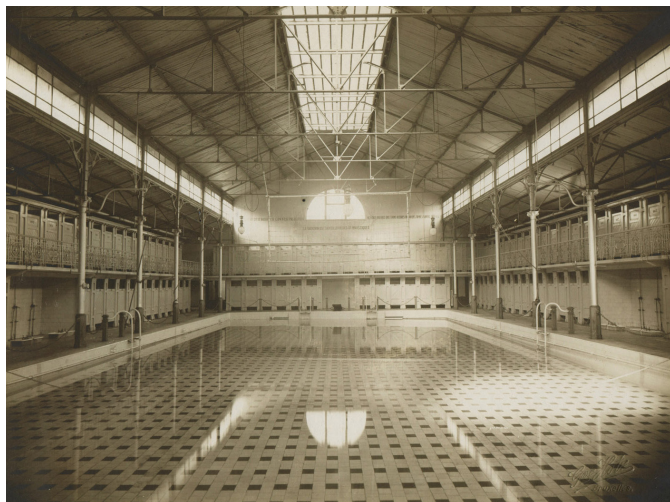
Voici à quoi ressemblait la piscine d'Ixelles au début du siècle dernier

La piscine d'Ixelles est la plus ancienne piscine couverte de la Région de Bruxelles-Capitale. Elle a fêté ses 100 ans le 16 mai 2004.